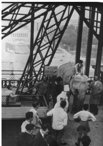
La elefanta estrella del circo Bouglione tras haber subido 327 peldaños hasta la 1ª planta (1948)

A través de 20 paneles cronológicos, la exposición, que puede visitarse dentro del monumento, muestra las hazañas más increíbles de las que la Torre ha sido testigo, rindiendo homenaje a quienes las llevaron a cabo. Desde las proezas más insólitas hasta las más vertiginosas, la Torre ha sido una fuente de inspiración en épocas y disciplinas diferentes. Entre las imágenes más sorprendentes se encuentran la de la elefanta del circo Bouglione subiendo en 1948 los 327 peldaños que hay hasta la 1ª planta, o la fotografía de la trapeicista Rose Gold junto con dos circenses haciendo unas espectaculares acrobacias colgada de la Torre Eiffel en 1951. En otras de las fotografías pueden verse, por ejemplo, al highliner Nathan Paulin cruzando sobre una cuerda de 2,5 cm los 670 metros que separan la Torre Eiffel y el Teatro Nacional de Danza Chaillot, en 2021.